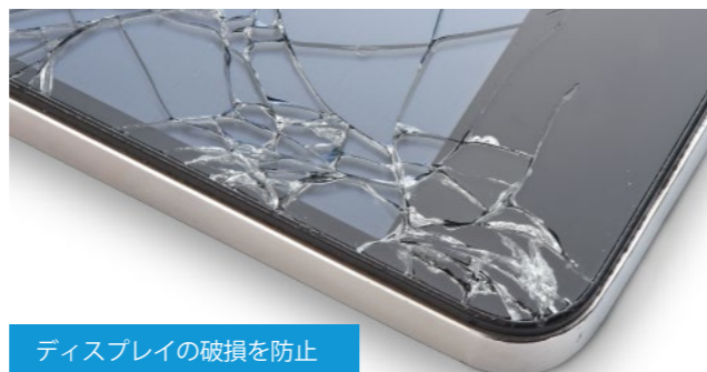
ディスプレイの破損を防止