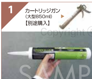
1 カートリッジガン (大型850ml) 【別途購入】