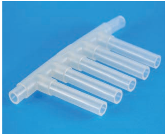
一体成形により滑らかな内面と高い信頼性を実現したC-フレックスマニホールド