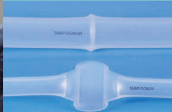
熱溶着による溶融接続 (ウェルド) (写真上) とシール部 (写真下)