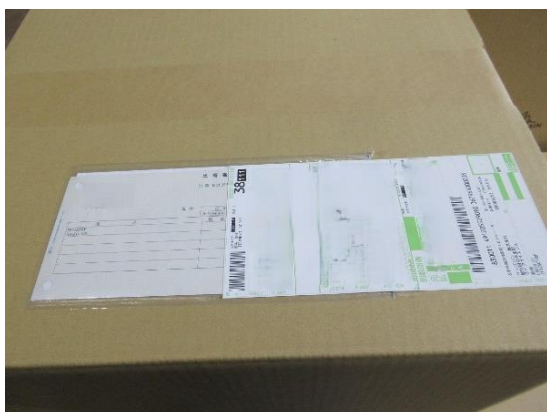
出荷案内書と同梱の場合

同梱されるロットや品番が多い場合などは、状況に応じ出荷案内書とは別に添付させていただく場合もあります。