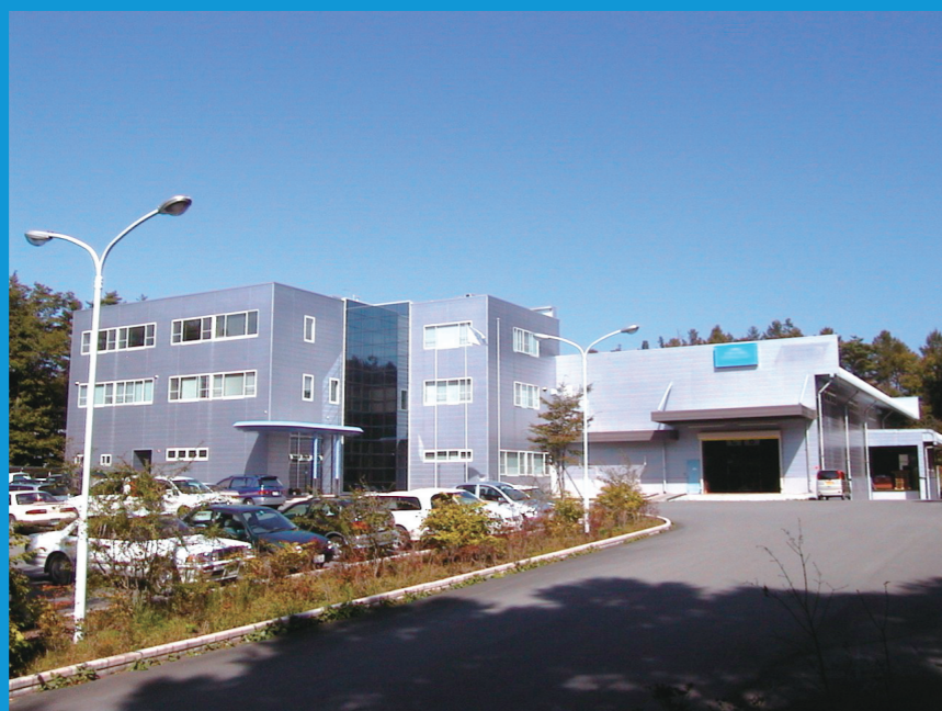
機能樹脂事業部 諏訪工場 諏訪工場(長野県)は、製造および研究開発の拠点となります。

サンゴバンは、ベルサイユ宮殿「鏡の間」の製作を担当すべく、1665年にフランス国王ルイ14世の宰相コルベールにより国営ガラスメーカーとして設立されました。今日では、パリに本部を置き、上場企業として、ヨーロッパ、アメリカ、アジアなど世界66ヶ国で事業展開をしている一大産業グループです。2016年6月現在、従業員は世界中で、170,000人を超え、年間売上は、5兆円以上に達しています。